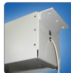
Detail von Gehäuse und Befestigung