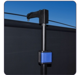
Ausziehung des Stativs