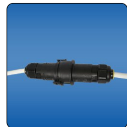
Detail der Verbindung des el. Anschlusses