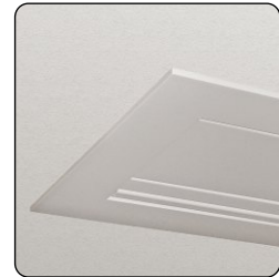
Die Bildwand eingebaut in der Deckenuntersicht