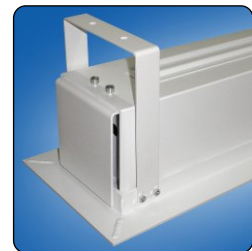
Detail des Bildwand und Rahmen