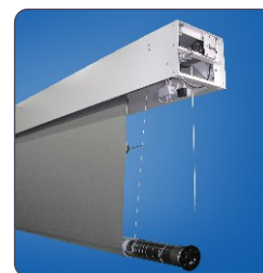
robustní tubus a navíjecí hřídel