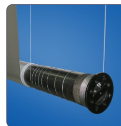
speciální navíjecí mechanismus