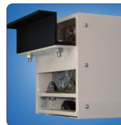
detail tubusu a upevnění