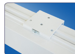
posuvné držáky 55 cm